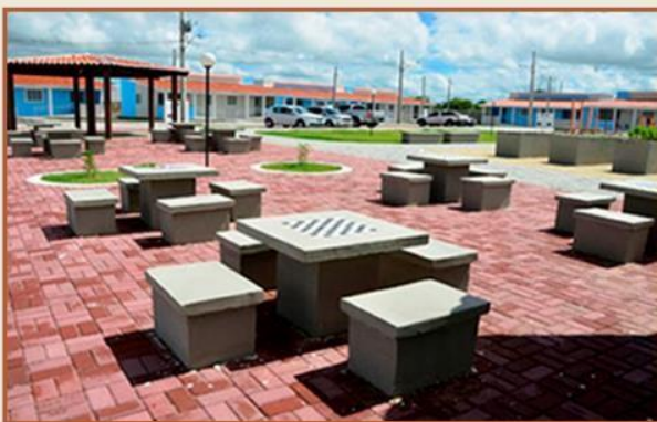
MESAS DE JOGOS