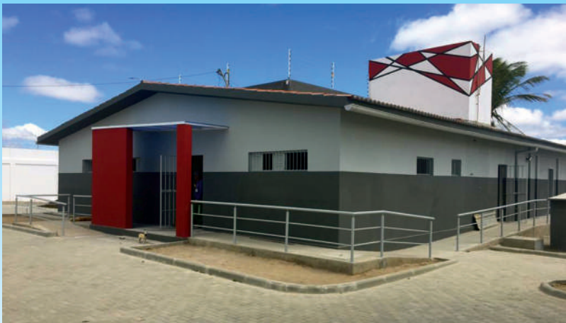
Cadeia de Remígio reformada