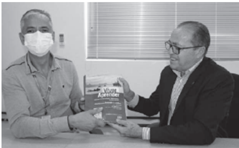
13 de abril - Bibliotecas de presídios ganham novos livros do IFPB e reforçam incentivo à leitura e aprendizagem