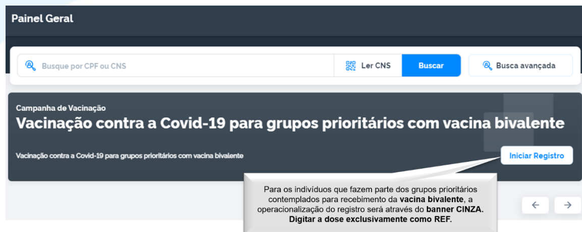
Figura 1: Banner da Vacinação contra a Covid-19 em 2023 - com vacina bivalente

Para registro da vacinação contra Covid-19, são utilizados os sistemas integrados com a RNDS como o Novo SIPNI OU e-SUS APS OU Sistemas Próprios Integrados , que irão garantir a identificação do cidadão vacinado pelo número do número do Cadastro de Pessoa Física (CPF) ou do Cartão Nacional de Saúde (CNS), para possibilitar a identificação, o acompanhamento das pessoas vacinadas e evitar duplicidade de vacinação.