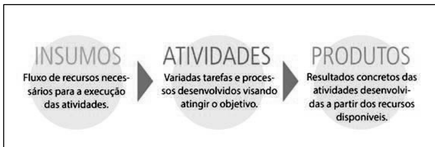
Figura 1 - Dimensões de Monitoramento e seus Conceitos

Serão observadas, nos processos de monitoramento, as seguintes dimensões: insumos, atividades e produtos.